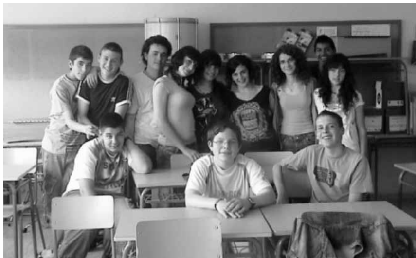
IES Andreu Sempere. Curs 2007-2008. 2n ESO C (PIP)

La unitat inclou continguts de les àrees de música i valencià principalment, encara que també recull altres continguts interdisciplinaris entre els quals dominen els de l'àrea de ciències socials. Tot això està recollit en una guia de l'alumnat (quadern de treball) i en una guia multimèdia del professorat (audicions, partitures, vídeos musicals, lletra de la cançó en diverses versions lingüístiques, etc).