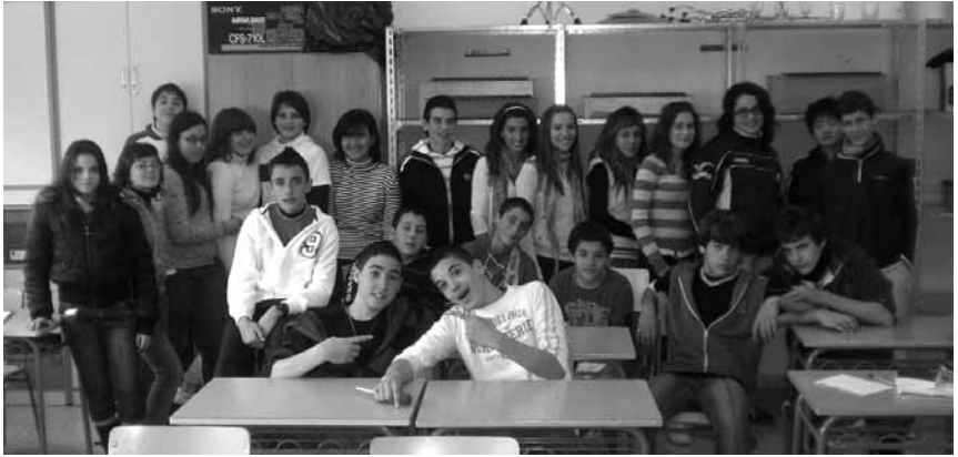
Curs 2008-2009 2n ESO B (PIP) Febrer 2009

Una segona fase d'experimentació més completa es va realitzar a finals de febrer de 2009 amb dos grups de 2n d'ESO (PIP): 2n d'ESO B i 2n d'ESO C.