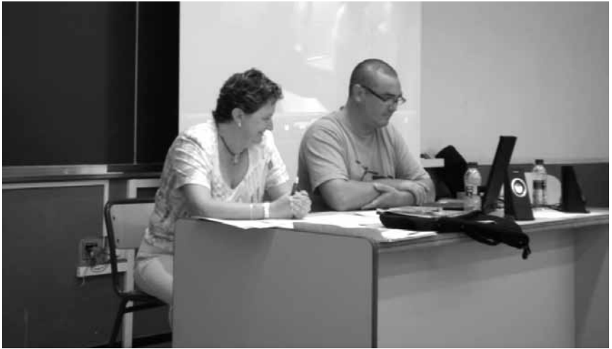
Presentació de la unitat temàtica TILC als cursos de la Universitat d'Estiu Rafael Altamira (2008)

Pel que fa als agrupaments, s'aposta pels agrupaments flexibles, que permeten treballar en gran grup (en el cas de les activitats musicals d'interpretació en les quals cadascú dels participants col·labora segons les seues possibilitats), treballar de manera col·laborativa en equips reduïts o per parelles (en el cas dels treballs d'investigació, recerca d'informació, preparació d'informes, etc), així com treballar individualment.